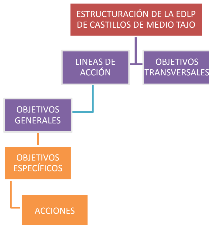
Secuencia de la estructura de la ESTRATEGIA DE DESARROLLO LOCAL PARTICIPATIVO DE CASTILLOS DE MEDIO TAJO

Líneas de acción que consolidan la Estrategia: en la siguiente tabla presentamos las líneas de acción y objetivos generales que conforman el Plan de Acción de esta Estrategia.